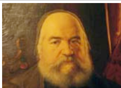
Eliphas LEVI (ex abbé CONSTANT)